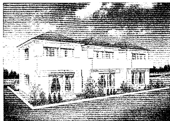
※パースはイメージです。